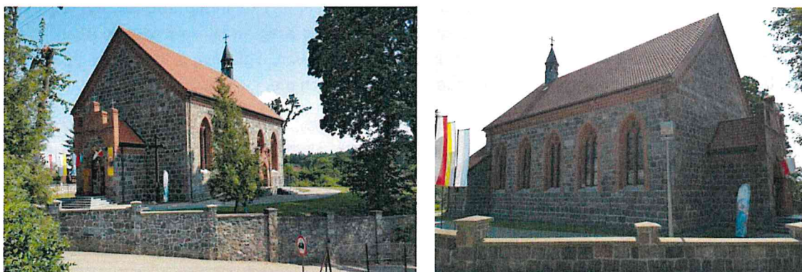
Fot.1-2. Kościół parafialny p.w. Świętej Trójcy w Sulęczynie.

Na terenie gminy Sulęczyno znajduje się jeden zespół objęty ochroną prawną poprzez wpis do rejestru zabytków. Jest to kościół parafialny p.w. Świętej Trójcy w Sulęczynie oraz teren przykościelny (d. cmentarz przykościelny) wraz ze znajdującym się na nim starodrzewem. Pierwsza tutejsza świątynia była drewniana i kryta gontem, jedynie jej posadzka była z cegieł. XVII-wieczny kościół padł pastwą płomieni 4 września 1872 r. Od spalenia udało się wtedy uratować jedynie trzy barokowe ołtarze, dar z Tczewa, stanowiące dziś wyposażenie kościoła. W miejscu spalonej świątyni w roku 1874 postawiono nową, wybudowaną przy wykorzystaniu kamienia polnego. Poświęcenia nowego kościoła dokonano w roku 1875. Kościół pierwotnie miał posiadać wieżę, lecz nigdy tego zamierzenia nie zrealizowano. W roku 2005 ściana frontowa kościoła uległa katastrofie budowlanej, zniszczona została główna kruchta. W tymże roku po odbudowie i kapitalnym remoncie kościół ponownie oddano do użytku wiernym. Wokół świątyni dawniej znajdował się cmentarz. Na tyłach kościoła znajdują się trzy dzwony, dwa z 1958 roku, jeden z roku 2006. Kościół jest budowlą neogotycką, wzniesioną w roku 1874. Obiekt znajduje się przy ulicy Kościelnej 1. Wpisany do rejestru zabytków pod nr 1762.